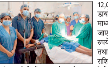
ऑपरेशन के बाद मरीजों की देखभाल और पुनर्वास में सहयोग प्रदान करने के लिए दी जाती है। उन्होंने बताया कि जिले में राष्ट्रीय कुष्ठ उन्मूलन कार्यक्रम के अंतर्गत कुष्ठ रोगियों की सक्रिय रूप से पहचान कर उन्हें निःशुल्क उपचार उपलब्ध कराया जा रहा है।