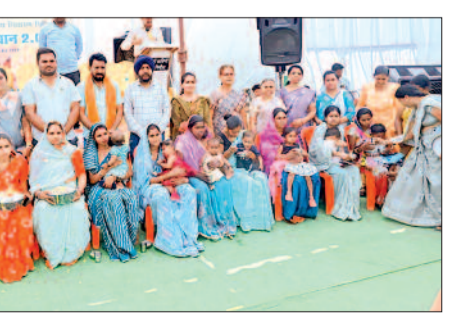
शासन की योजनाओं की जानकारी दी गई तथा उनकी समस्याओं का

■ ग्रामीणों को योजनाओं की मिली जानकारी हरिभूमि न्यूज | पिथौरा जिले के आकांक्षी विकासखंड पिथौरा अंतर्गत ग्राम लाखागढ़ में जनसमस्या निवारण शिविर का आयोजन किया गया, जिसमें विभिन्न विभागों द्वारा ग्रामीणों को